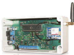
JULIA – jednostka centralna

Instalacja systemu JULIA jest bardzo prosta. Wystarczy podłączyć przewody z termostatu oraz kotła do odpowiednich zacisków jednostki centralnej... i gotowe! Konfiguracja aplikacji systemowej jest również łatwa i raczej nie sprawi nikomu żadnego problemu.