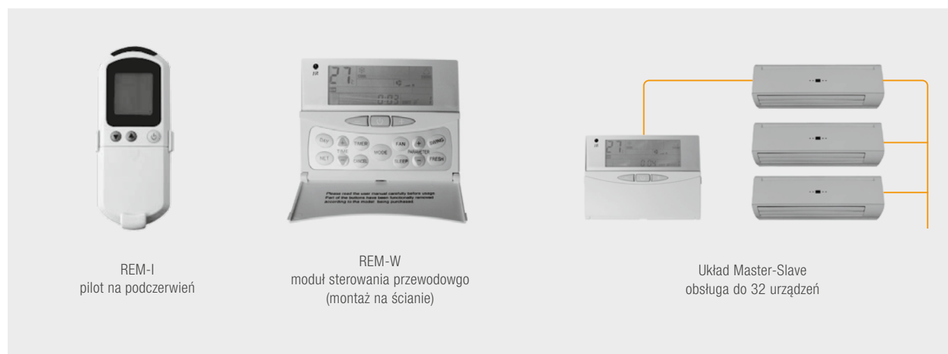
REM-I pilot na podczerwień