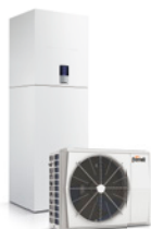
OMNIA ST 4-6