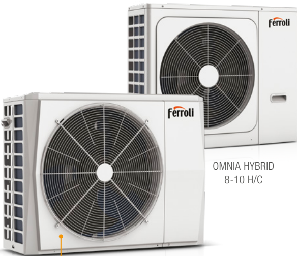
OMNIA HYBRID 8-10 H/C