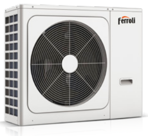
OMNIA SW-T 8-10